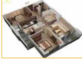
Tòa nhà Phần sở hữu riêng

Becamex Tokyu mua bảo hiểm cho các Khu vực công cộng bao gồm Tòa nhà và Tài sản bên trong