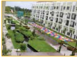
Tài sản bên trong Phần sở hữu chung