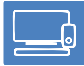
Các đồ dùng và thiết bị gia dụng