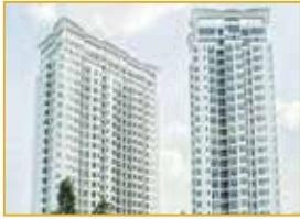
Tòa nhà Phần sở hữu chung