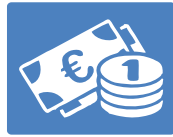
Tiền (dưới mọi hình thức)