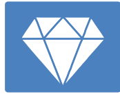
Đồ trang sức và các tài sản có giá trị